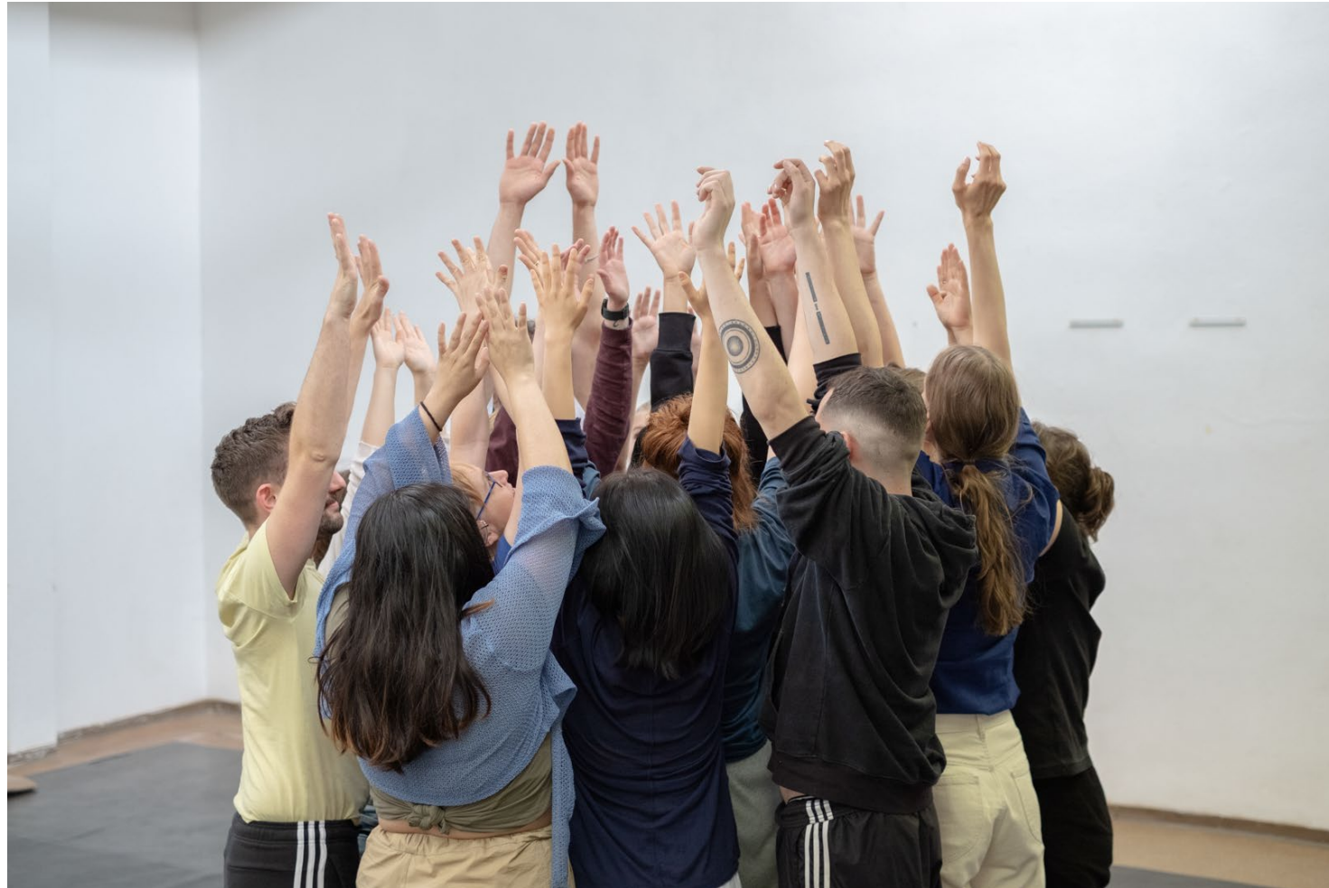
kT Fellows Uni Hildesheim 2022