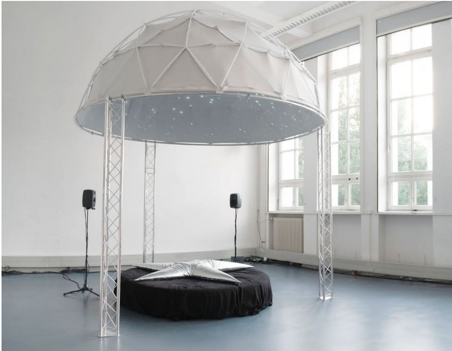
Conjunktion Universität der Künste Berlin