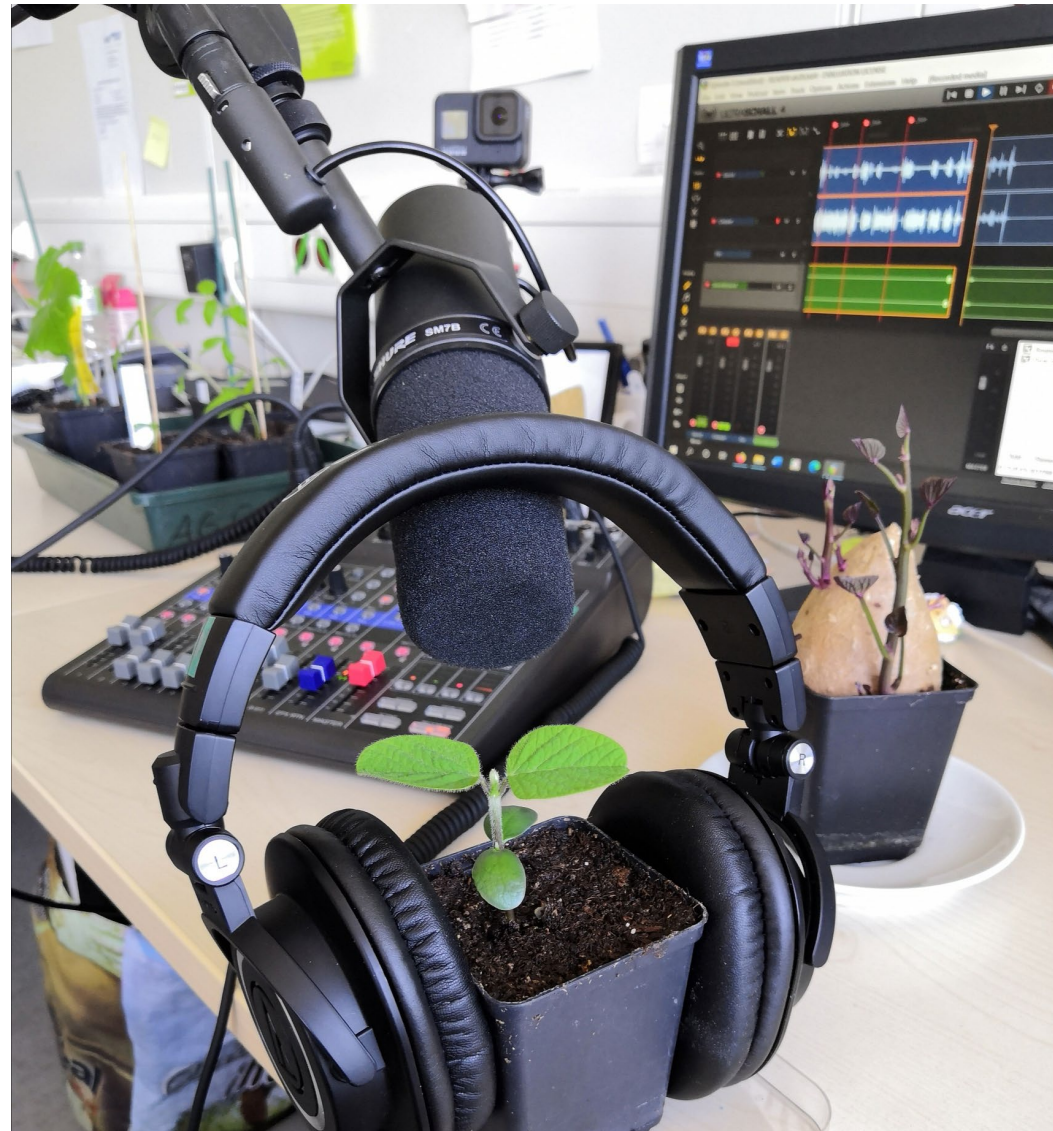
Krautnah – Der Pflanzenforschungspodcast für Jedermann, RWTH Aachen 2020/21